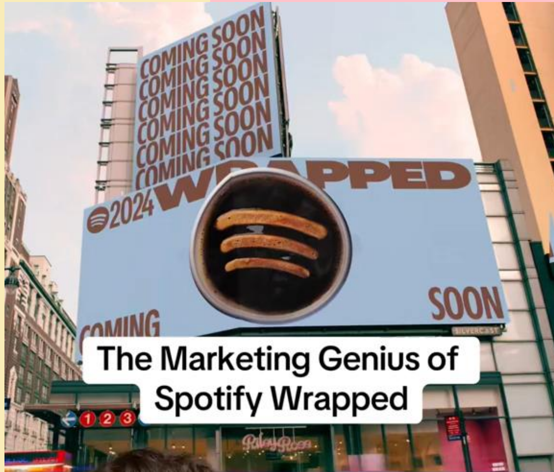
The Marketing Genius of Spotify Wrapped